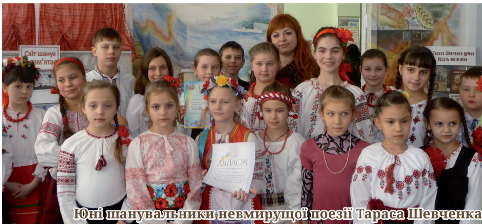
Юні шанувальники невмирущої поезії Тараса Шевченка

Традиційно початок березня в Україні ознаменовується не лише віншуванням жінки-матері, трудівниці, а й величними Шевченківськими днями. Справді, цьогорічна 199-та річниця з дня народження поета, художника, патріота Тараса Шевченка проходила під знаком активної підготовки до святкування 200-річного ювілею видатного українця. Але заходи, у яких брали участь діти, як завжди, - особливі, третні й варті уваги.